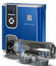
eXO® iQ LS