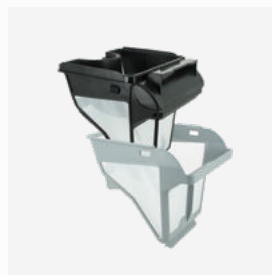
Filterkorb Zweistufige Filtration: 150/60 µ