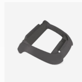
Sockel für die Steuerbox