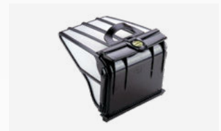
Großer Filterkorb (5L)

Leicht herausnehmbar und einfach zu reinigen