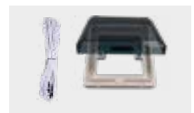
Set für Fernsteuerung