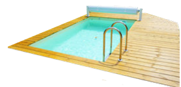
Eingegrabener Pool <35m 3