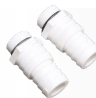
PVC-Anschlüsse Ø 32-38 mm