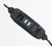
Steckdose mit Differenzialschutzsperre 10 mA und 5 m Kabel

Mehrsprachige Verpackung mit verstärkter Struktur und einschließlich des gesamten Zubehörs