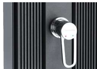
Mitigeur finition Inox gravé au laser