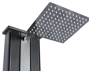
Pomme de douche intégrée anti-calcaire