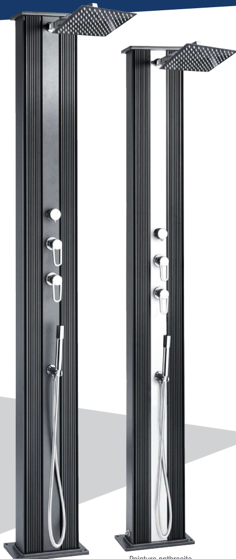
Peinture anthracite DS-D463NO

Formidra renouvelle son modèle phare, la Dada. Disponible en version droite ou courbée, celle-ci associe la technologie solaire écologique Formidra avec une contenance de 40 L, à une arrivée d'eau chaude, pour garantir des douches à température, quel que soit le nombre d'utilisateurs.