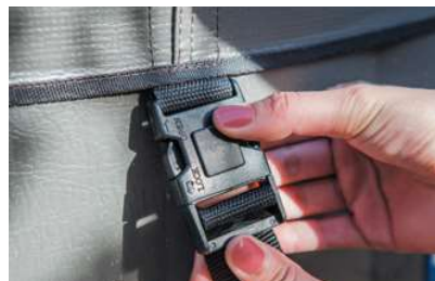
Système de fermeture sécurisé