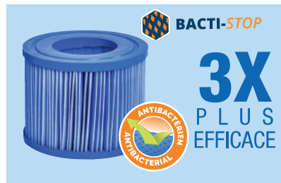
1 cartouche de filtration antibactérienne incluse