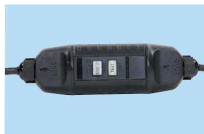
Prise électrique avec protection différentielle 10 mA