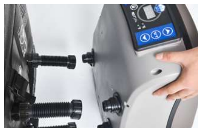
Bloc moteur amovible